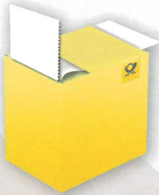
Marken-Box* mit 100 selbstklebenden Marken zu 85+40 Cent