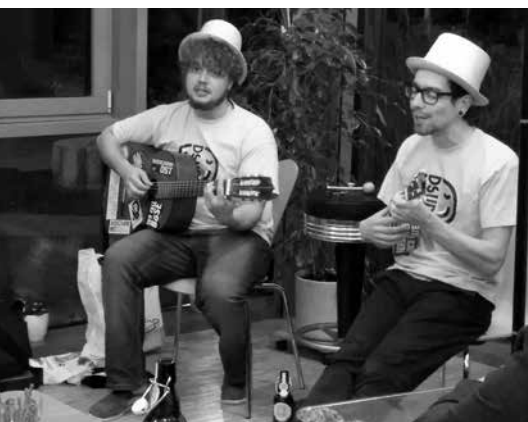
„Die Schöne und das Biest (oben) und Benjahmmin (unten)