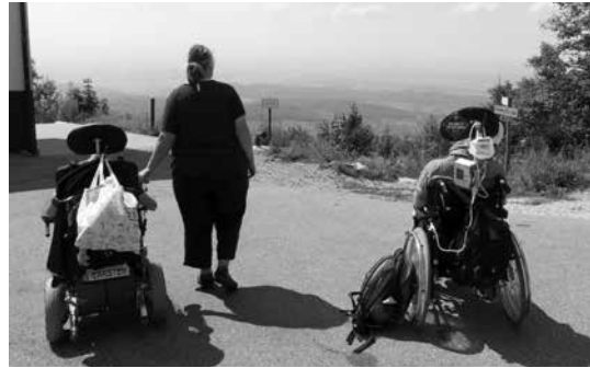
Herrliche Aussichten in luftiger Höhe

Die Rückfahrt ging dann über das Städtchen Staufen im Breisgau, das mit einer malerischen Altstadt und einer eindrucksvollen Burg ruine aufwarten kann. Inzwischen ist es aber auch durch die fortschreitenden und allseits sichtbaren Risse in den Gebäuden infolge einer stümperhaften Tiefbohrung im Jahre 2007 zu trauriger Berühmtheit gelangt.