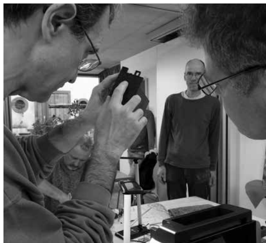
An der Elektrostation wird getüfelt

einem Brunch. Nach der Stärkung und einem kurzen Umbau startet dann immer das Repair Café. Das Repair Café besteht aus einem Nähtisch und einer Elektrostation, an der alles mit Kabel repariert wird. Eine weitere Station war für Schreinerarbeiten und Fahrradreparaturen vorgesehen. Jeder, der etwas zu reparieren hatte, konnte ohne Voranmeldung vorbeischaun. So wurde z.B. ein Drucker, ein Navigationsgerät fürs Auto, eine Lampe, ein Radio und ein Schaukelstuhl repariert.