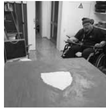
Das Logo nimmt Gestalt an