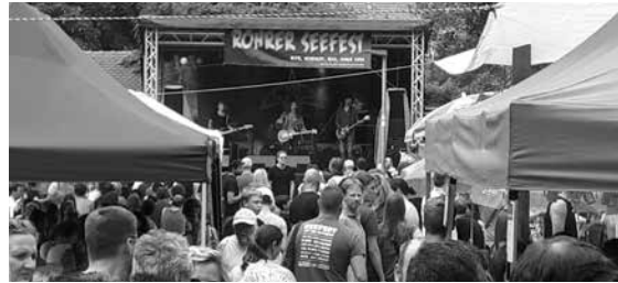
Ordentlich was los beim Rohrer Seefest

Wir können allen dieses Festival wärmstens empfehlen. Am 15. und 16. Juni 2019 findet das 45. Seefest statt. Der Termin ist bereits Geschichte, wenn dieses KBV aktuell erscheint. Aber beim 46. Seefest im Jahr 2020 gibt es die nächste Chance, Spaß zu haben und eine andere soziale Einrichtung zu unterstützen. Unter www.rohrer-seefest.de gibt es immer aktuelle Informationen.