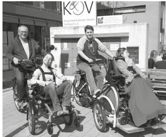
Unser OPair (links) und das Velo Plus

Im Jahr zuvor hatten wir bereits ein Velo Plus gekauft. Das ist ebenfalls ein Dreirad, aber hier gibt es vorne keine Sitzschale, sondern eine Plattform, auf die man mit dem eigenen Rollstuhl auffahren kann. Dieses Rad ist deutlich sperriger und schwerfälliger als das OPair, hat aber den Vorteil, dass der Passagier im eigenen Rollstuhl sitzen bleiben kann. Das ist besonders für Menschen gut, die sich in einem normalen Sitz alleine schlecht halten können. Große E-Rollis sind allerdings tabu, weil es eine Gewichtsgrenze gibt.