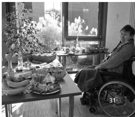
Tolle Auswahl beim Brunch

einem Brunch. Nach der Stärkung und einem kurzen Umbau startet dann immer das Repair Café. Das Repair Café besteht aus einem Nähtisch und einer Elektrostation, an der alles mit Kabel repariert wird. Eine weitere Station war für Schreinerarbeiten und Fahrradreparaturen vorgesehen. Jeder, der etwas zu reparieren hatte, konnte ohne Voranmeldung vorbeischaun. So wurde z.B. ein Drucker, ein Navigationsgerät fürs Auto, eine Lampe, ein Radio und ein Schaukelstuhl repariert.