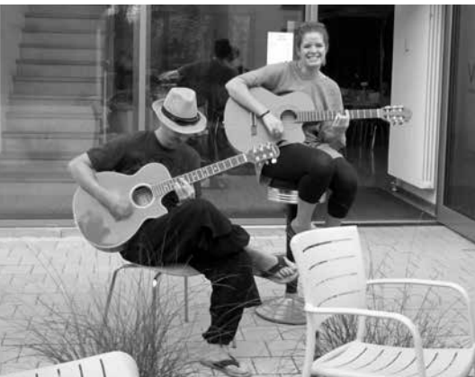
„Seasaw“ bei der Eröffnung des TiK