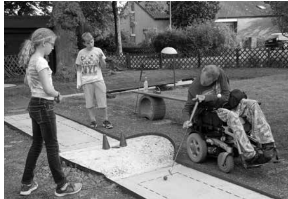
Höchste Konzentration beim Minigolf

Gutes Essen ist bei den Grufties immer dabei. Am liebsten selbstgemacht.