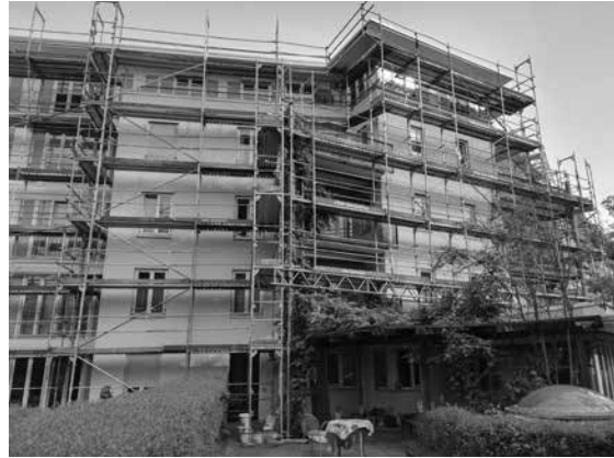
Die Villastraße 1A mit Baugerüst

Sie leben oft auf der Straße und betteln. Die Familie muss für die Menschen sorgen, es gibt wenig Hilfe vom Staat. Hier in Deutschland haben Menschen mit einer Behinderung viel mehr Platz in der Gesellschaft,