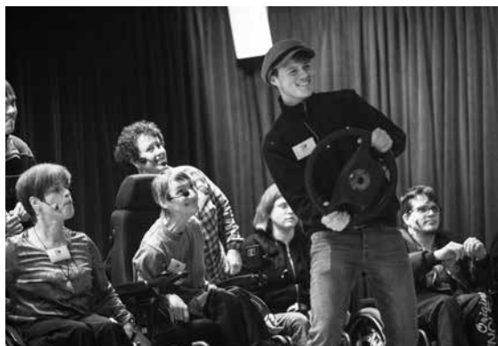
Die täglich Busfahrt

Der „Andersartige“ stößt auf viele Vorurteile