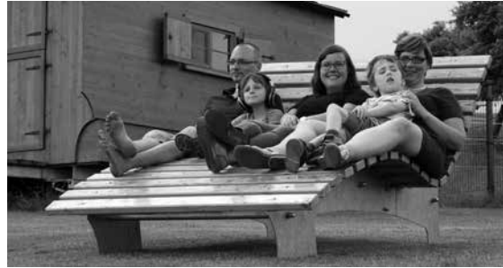
Familientage - Zeit füreinander