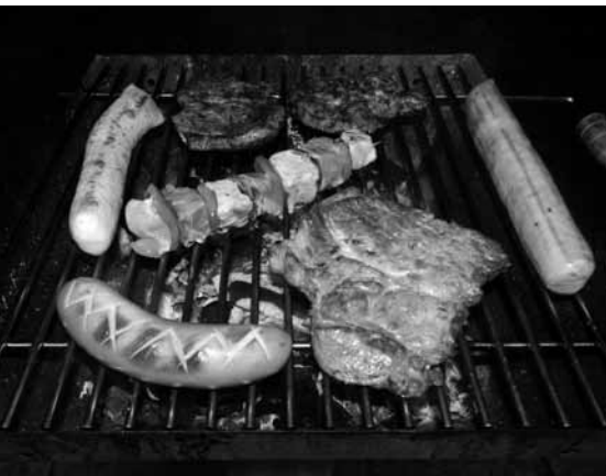
Grillen ist das Sommerprogramm am Mittwochabend

Das Ziel der Freizeit war immer das eine, aber der Urlaub war nur so schön, wie die Gruppe es zuließ. Da wir sehr tolerant sind, hatten wir immer eine sehr schöne Zeit.