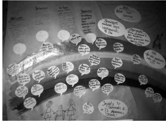
Beim Projekt wird intensiv gearbeitet

Bei unserem ersten Treffen im Mai haben wir Überthemen herausgearbeitet, nachdem wir uns ausgetauscht hatten über das, was all diese Fragen in uns auslösen: