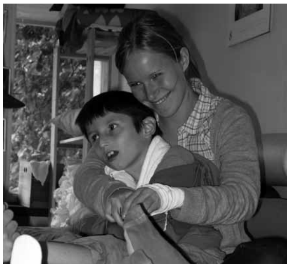
Entspannung in kühlen Räumen

und die Einsatzgruppen zusammengestellt. Jetzt ging es ans Eingemachte. Nutzte man die Zeit zur körperlichen Ertüchtigung oder wagte man sich in den Bewegungsgarten und lief Gefahr, von den Piraten gefangen genommen zu werden?