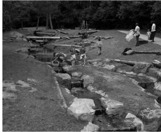
Der neue Wasserspielplatz an der Nagold

Geplant und organisiert wurde natürlich schon lange, bevor es los ging. Beim Vortreffen im April konnten sich die teilnehmenden Familien schon einmal kennenlernen. Neben dem „harten Kern“ finden auch immer neue Familien den Weg zu uns und zeigen Interesse an den Familientagen. Fast alle konnten kommen und wir genossen einen herrlichen Nachmittag bei strahlendem Sonnenschein im Kindergarten Sonnenblume. Zimmeraufteilungen wurden besprochen, Programmwünsche gesammelt und Mitfahrgelegenheiten organisiert. Ganz wichtig ist immer das Thema Essen. Wir haben Vegetarier und Diabetiker dabei, müssen auf Lactose- und Fructoseintoleranz Rücksicht nehmen und auf unser Budget achten.