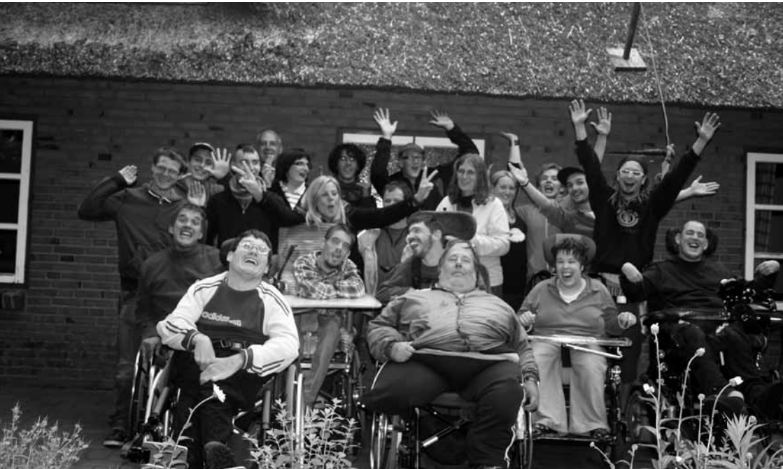
Die ganze Truppe „zu Hause“