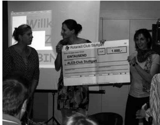
Der Rotaract Club übergibt einen Scheck

Das Team „Freizeit und Familie“ wird für die Bingo-Gewinner kochen