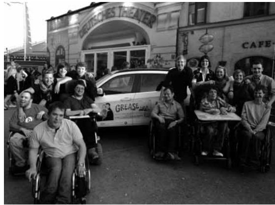
Das Musical „Grease“ hat alle begeistert

Aus der Vielzahl der Möglichkeiten, die ich