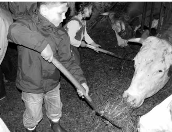
Harte Arbeit für das „Kuh-le“ Diplom

Für die „Geschwisterkinder“ war es eine schöne Zeit. Sie hatten viel Raum und konnten sich so richtig austoben. Auch die Eltern hatten mehr Zeit als zu Hause, weil man das behinderte Kind auch mal jemand anderem abgeben konnte und der Alltag einfach ausen vor blieb.