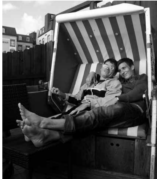
Kann Seelenfrieden schöner sein?