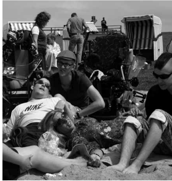
Entspannung im warmen Sand

Nordisch, friesisch, herb: so war auch das Wetter. Wir hatten uns schnell daran gewöhnt, dass der Wind ein ständiger Begleiter ist und dass er aber auch dafür sorgt, dass die Regenwolken sich schnell wieder verziehen.